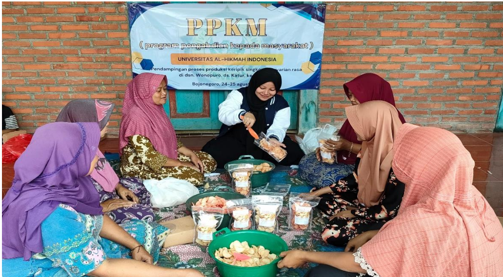
Gambar 5.1 Pelatihan pembuatan keripik singkong

Dengan begitu, pada bab ini akan dijelaskan beberapa aksi nyata ( Real Action ) sebagai bagian dari pengaplikasian participatory action research yang menjadi konsep kuliah kerja nyata (KKN) di UNIVERSITAS AL HIKMAH INDONESIA. proses aksi yang dilakukan dalam usaha untuk mengurangi adanya jumlah pengangguran yang terjadi di Dusun Wonopuro Desa Katur Kecamatan Gayam Kabupaten Bojonegoro.