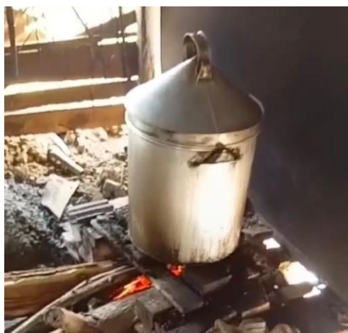
Gambar 2. Proses kedua kedelai direbus

Dampak sosial yang muncul dari proses pendampingan menunjukkan transformasi yang positif. Terbentuknya kelompok produksi tempe menjadi struktur sosial baru yang memperkuat koordinasi dan kerja kolaboratif di tingkat desa. Perubahan perilaku warga juga tampak jelas, terutama dalam kedisiplinan menjaga kebersihan produksi, semangat untuk menghasilkan produk berkualitas, dan meningkatnya motivasi berwirausaha. Dalam prosesnya, beberapa warga menonjol sebagai pemimpin lokal yang berperan menggerakkan kelompok, mengoordinasikan produksi, serta menjadi jembatan komunikasi antaranggota. Kehadiran pemimpin lokal ini menjadi modal sosial yang penting dalam memastikan keberlanjutan program.