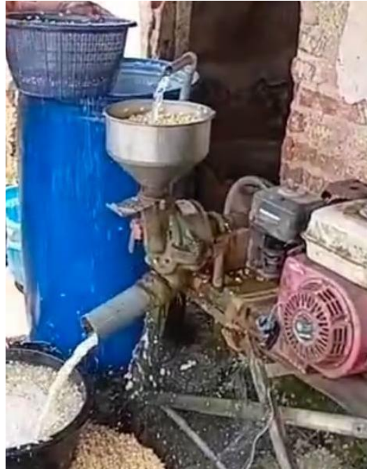
Gambar 1. Langkah pertama mencuci dan selep kedelai

penguatan keterampilan teknis, pendampingan juga membantu warga membentuk kelompok usaha yang kemudian menjadi wadah koordinasi produksi, pembagian tugas, dan perencanaan usaha. Kelompok ini berkembang sebagai pranata baru yang mendukung keberlanjutan program berbasis kekuatan komunitas.