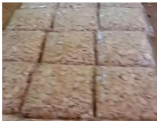
Gambar 3. Setelah peragian, tempe diwadahi sesuai selera

Dampak sosial yang muncul dari proses pendampingan menunjukkan transformasi yang positif. Terbentuknya kelompok produksi tempe menjadi struktur sosial baru yang memperkuat koordinasi dan kerja kolaboratif di tingkat desa. Perubahan perilaku warga juga tampak jelas, terutama dalam kedisiplinan menjaga kebersihan produksi, semangat untuk menghasilkan produk berkualitas, dan meningkatnya motivasi berwirausaha. Dalam prosesnya, beberapa warga menonjol sebagai pemimpin lokal yang berperan menggerakkan kelompok, mengoordinasikan produksi, serta menjadi jembatan komunikasi antaranggota. Kehadiran pemimpin lokal ini menjadi modal sosial yang penting dalam memastikan keberlanjutan program.