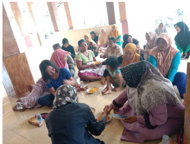
Gambar 1: Pelatihan Pembuatan Emping Jagung Bersama Warga